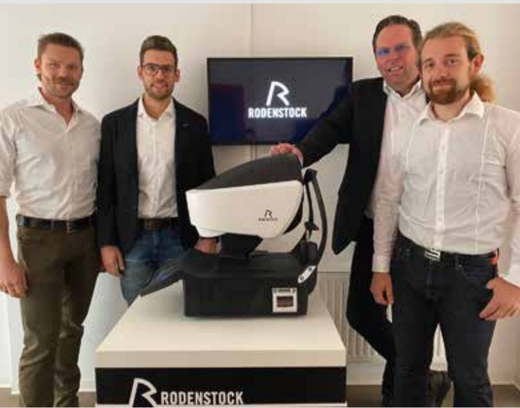
Das Meisterteam vermisst Ihre Augen mit dem DNEye® Scanner von Rodenstock.